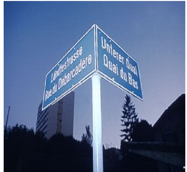
Alle Strassenschilder sind zweisprachig in Biel/Bienne!