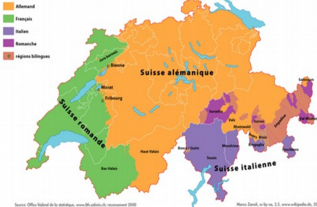
Répartition géographique des langues officielles en Suisse (2000)