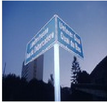
Alle Strassenschilder sind zweisprachig in Biel/Bienne!