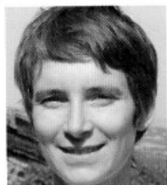
Par Estelle Levesse

Alors que la maîtrise d'au moins deux langues étrangères est annoncée comme une priorité, nombreux sont ceux qui s'interrogent sur la place occupée par les langues dans le système éducatif français. Enquête de la rédaction.