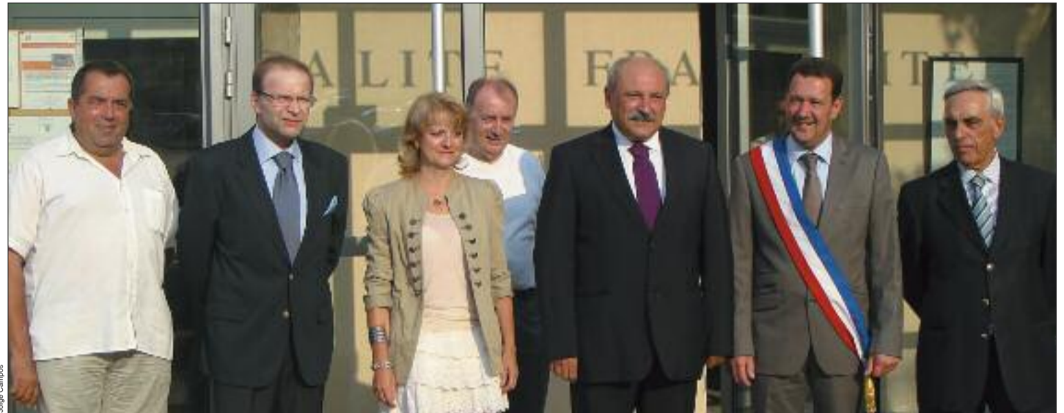
As duas delegações em Ste Consource

A localidade de Ste. Consource faz parte do "grande Lyon". Esta aglomeração tem um projeto de geminação com a vila portuguesa de Fornos de Algodres, no distrito da Guarda.