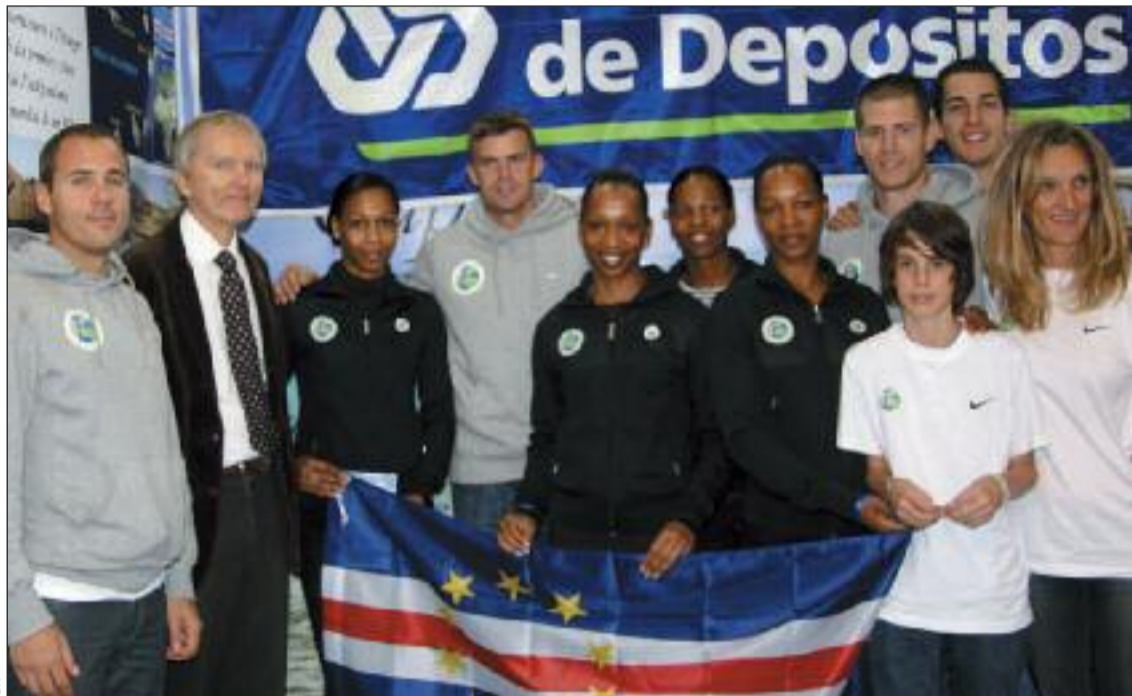
Cap Vers les Etoiles avec le Consul Honoraire du Cap Vert à Marseille

La semaine dernière, le Consul du Cap Vert à Marseille a visité le stand de l'association Cap Vers les Etoiles dans le village expo du Marseille-Cassis et toute l'équipe était là pour prendre une photo souvenir. Les jeunes athlètes luso-capverdiennes ont le soutien de l'Ambassade du Cap Vert et aussi du Consul honoraire du Cap Vert à Marseille «que