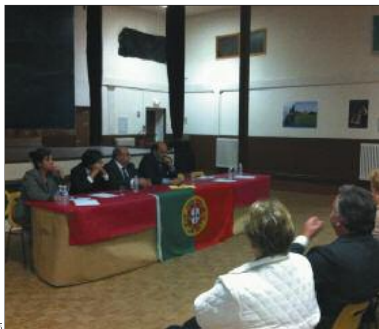
Mesa da reunião

A importância do movimento associativo, o seu papel integrador e as