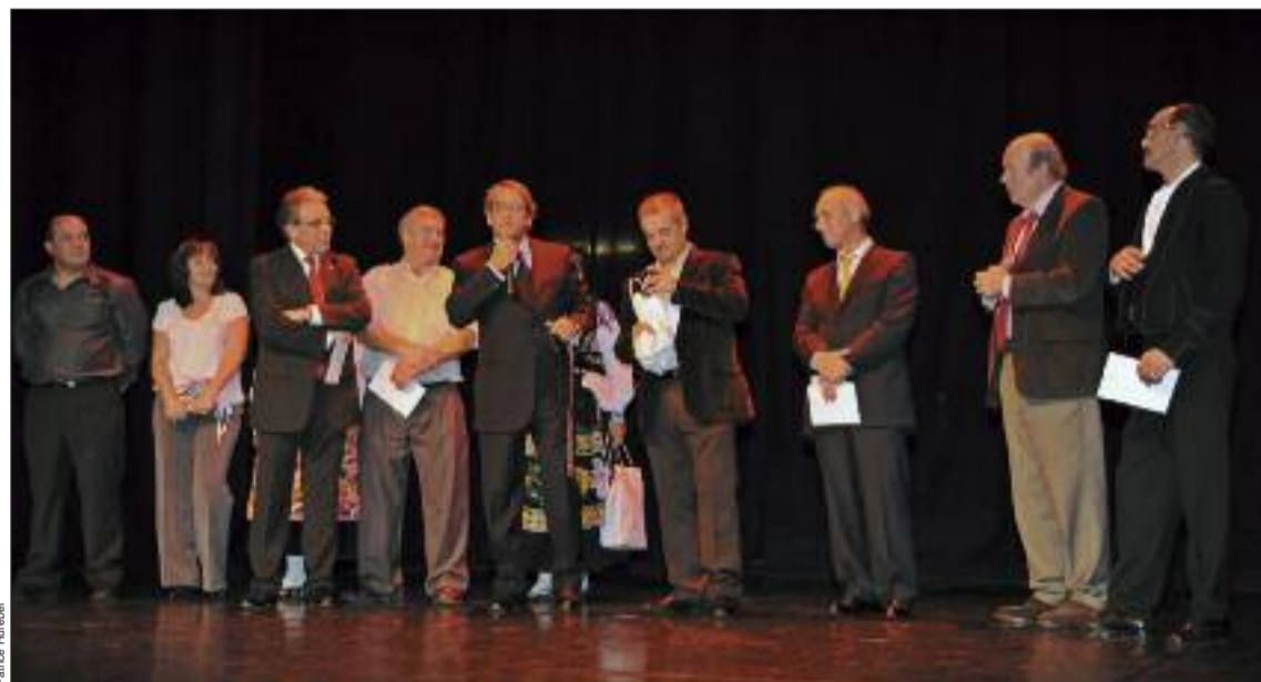
Momento da cerimónia protocolar

Cerca de 400 convidados participaram no sábado passado no jantar comemorativo dos 30 anos do Rancho folclórico Ronda Típica de Chalette-sur-Loing (45), um grupo que integra a Association Portugaise du Gâtinais.